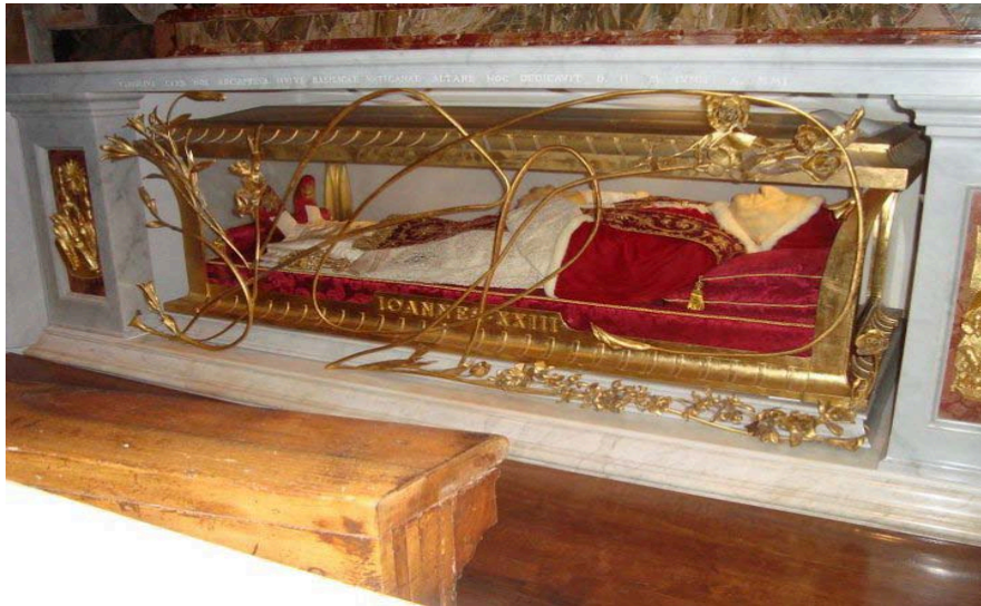
Den døde pave i Sankt Peters kirken.

Vi mødtes alle ved receptionen kl. 12.00. vi tog bussen til Prima Porta, så vi kunne tage toget til Vatikan Staten. Vi ventede i et stykke tid på guiden, som viste sig at være en sød dansker. Han viste os rundt på museet og var rigtig god til at fortælle. De to mest interessante ting vi så var det Sixtinske Kapel og Skt. Peters kirken. Det Sixtinske Kapel havde store flotte malerier i loftet, malet af Michelangelo. Skt. Peters kirken var fantastisk stor og smuk, og nogle af os så Paven inde i kirken, under en gudstjeneste. Da vi var færdige splittedes vi i grupper for at gå ud og få noget at spise. Da vi kom hjem mødtes vi i baren til en drink. Eller 10..