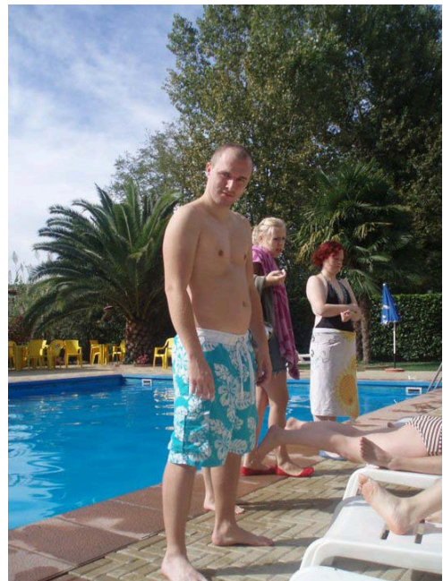
"Det er sgu da ham fra Baywatch?!"