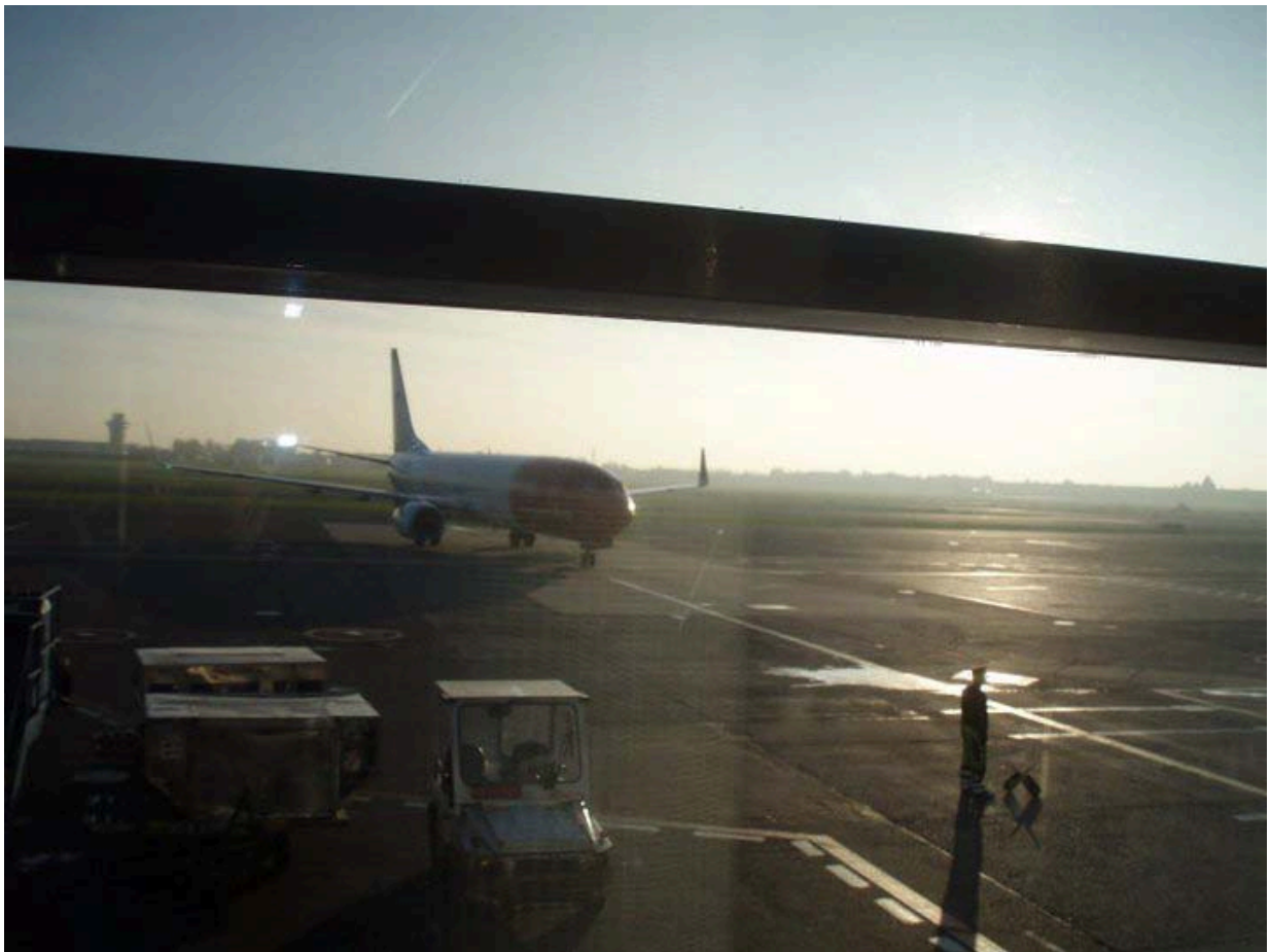
Dette er flyet vi fløj til Rom i.